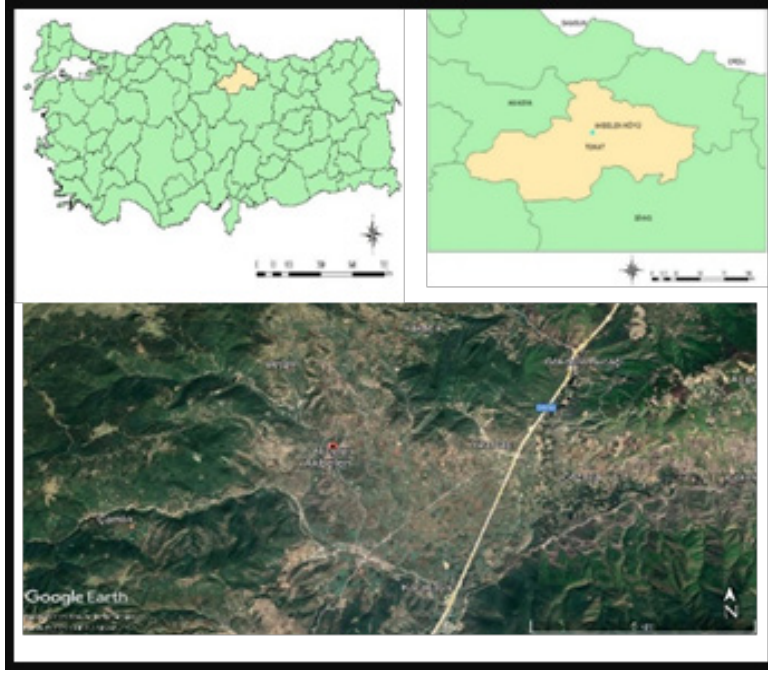
Harita 1: Akbelen Köyü Lokasyon Haritası

Akbelen köyünün kuruluş tarihi tam bilinmemekle birlikte Milattan öncesine dayanan bir tarihi olduğu ileri sürülmektedir. 407 yılında Önemli Hristiyan azizlerinden olan İoannes Hrisostomos'un Tokat'ta sürgündeyken Komana Pontika'da vefat etmesi üzerine Akbelen köyüne defnedilmiştir. 20. Yüzyılda Ermeni yerleşmesi olan köyde 280 Ermeni nüfusu ile bir miktarda Rum nüfus bulunmaktaydı. 24 1940'lı yıllarda Dersim olayları nedeniyle Kürtler de Akbelen'e yerleşmiştir. Köy halkının şu anki etnik durumu Sünni Türk'tür.